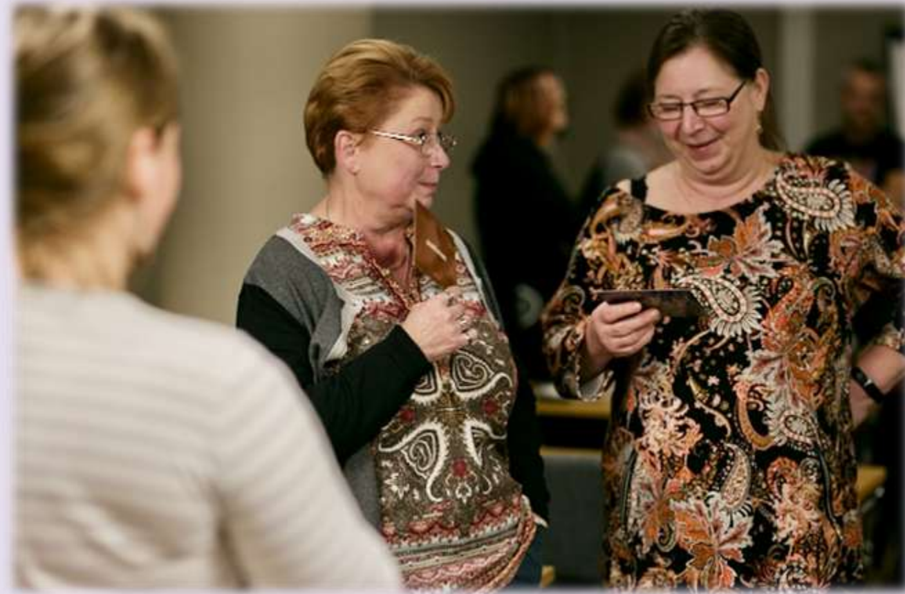
Verrattomien vapaaehtoisten koulutus 2021

Vapaaehtoisemme perehdytetään ja koulutetaan tehtävään, ja järjestösuunnittelijat tukevat tekemistä jatkossakin.