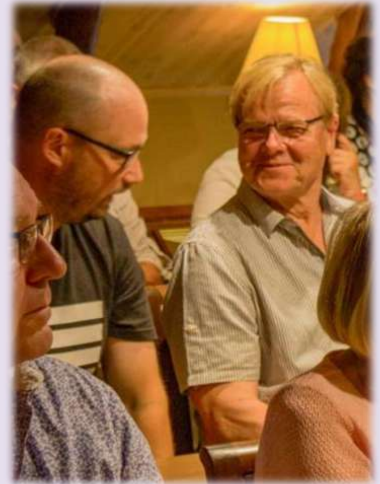
Syksyn vertaispäivät Raumalla 2022