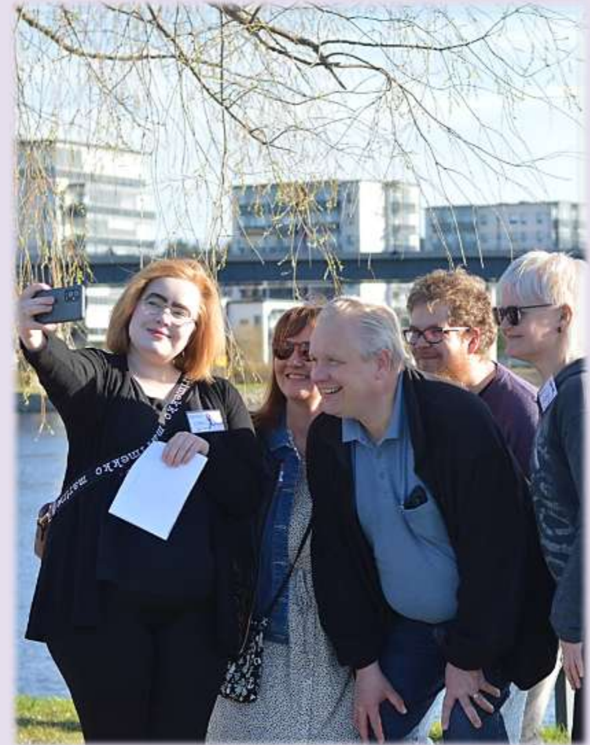
Kevätpäivät Joensuussa 2022

Jäseniä meillä on noin 9 000 ja koulutettuja vapaaehtoisia noin 80.