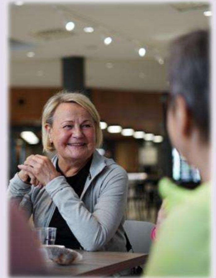
Hyvän olon päivät 60-vuotta täyttäneille 2022